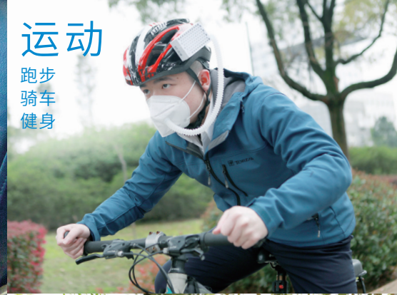
运动 跑步 骑车 健身