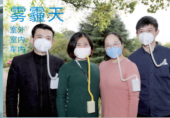
雾霾天 室外 室内 车内