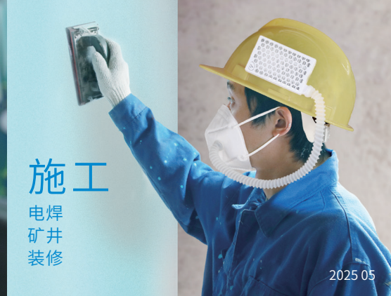
施工 电焊 矿井 装修