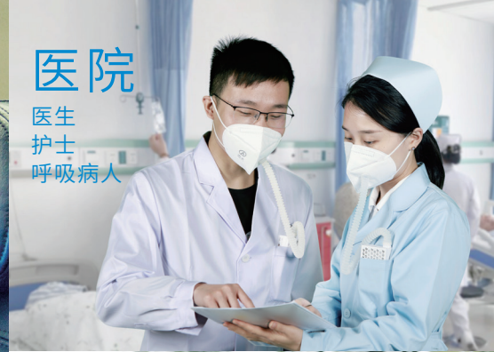
医院 医生 护士 呼吸病人